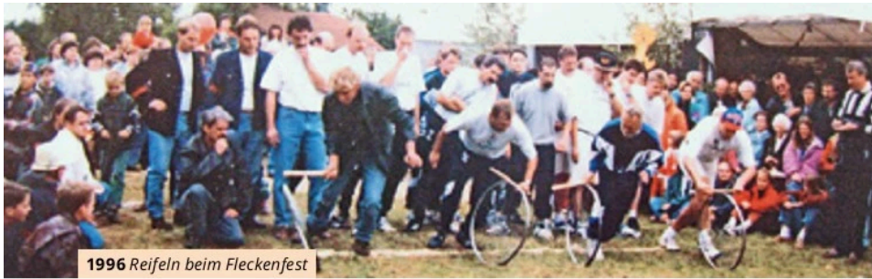
1996 Reifeln beim Fleckenfest