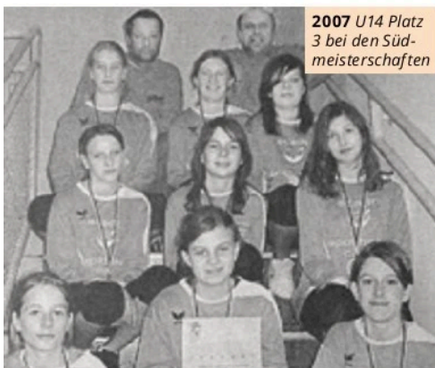
2007 U14 Platz 3 bei den Süddeutschen Meisterschaften