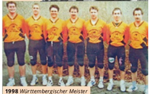
1998 Württembergischer Meister