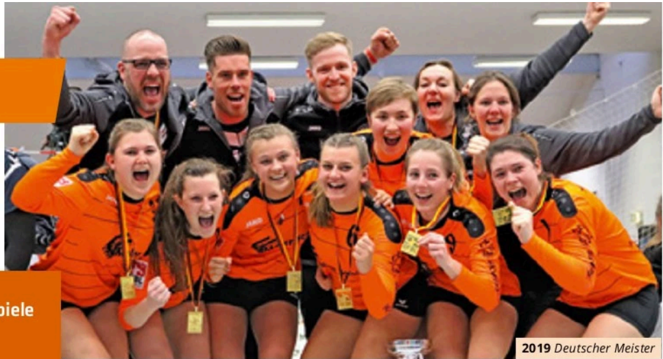
2019 Deutscher Meister